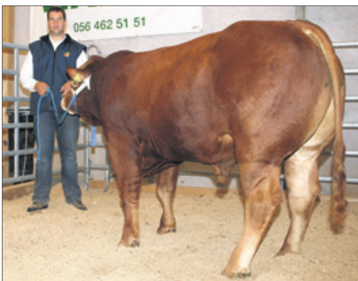
Der Elite-Limousine Gallikers Henric war mit 93 Punkten beurteilt und galt am 4. September in Brunegg 5500 Franken.